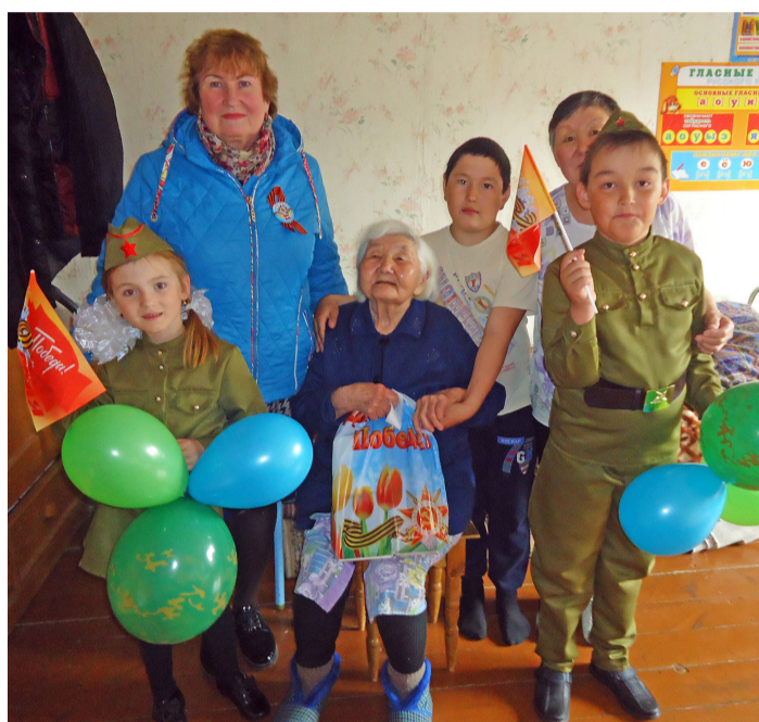
Северо-Байкальском коопзверопромхозе. Несмотря на преклонный возраст, ветеран